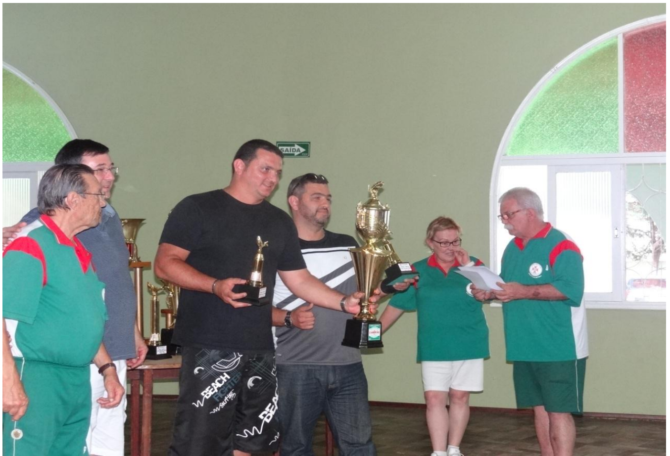
OS BI-CAMPEÕES DE DUPLA, 2013/2014.....