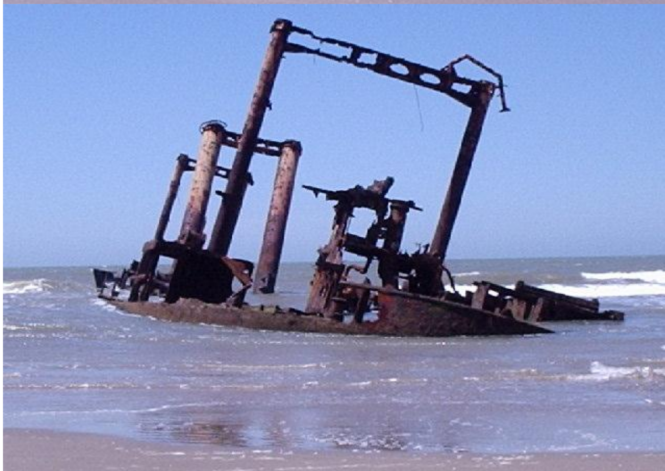
HOJE - NAUFRÁGIO:PRAIA-CASSINO-06/06/1976