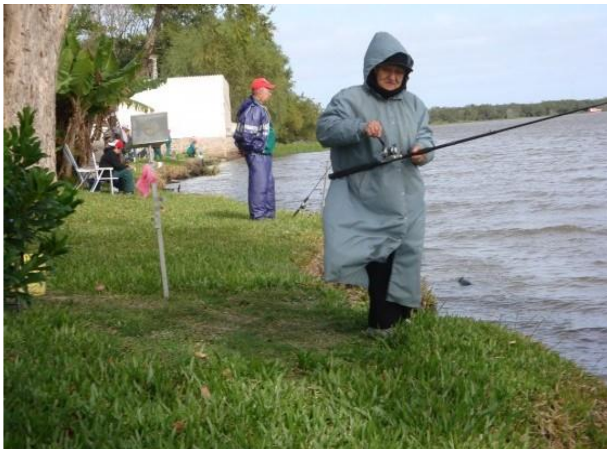
NEM VENTO, NEM FRIO, ATRAPALHA....