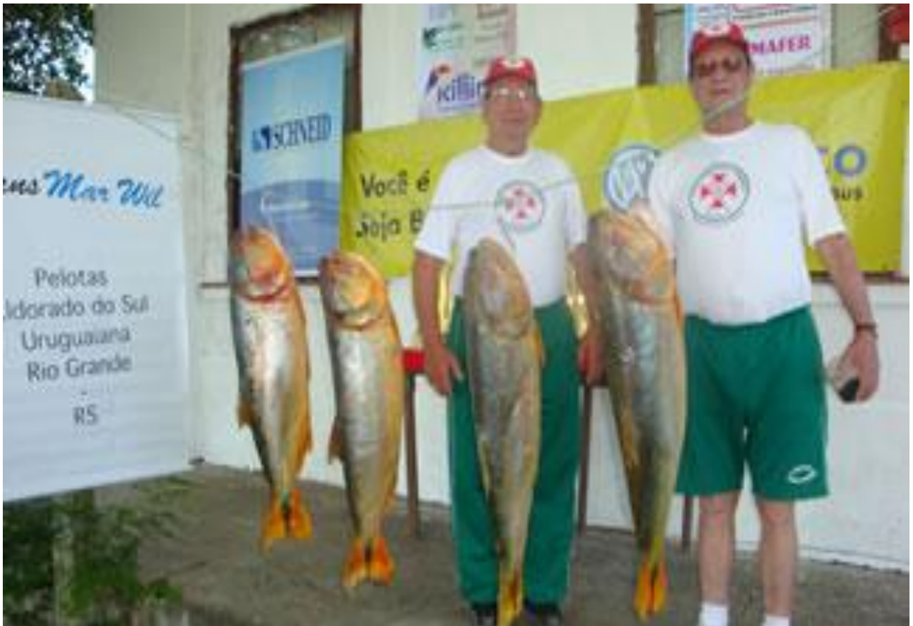
NO ARROIO? NÃO ACREDITO.....