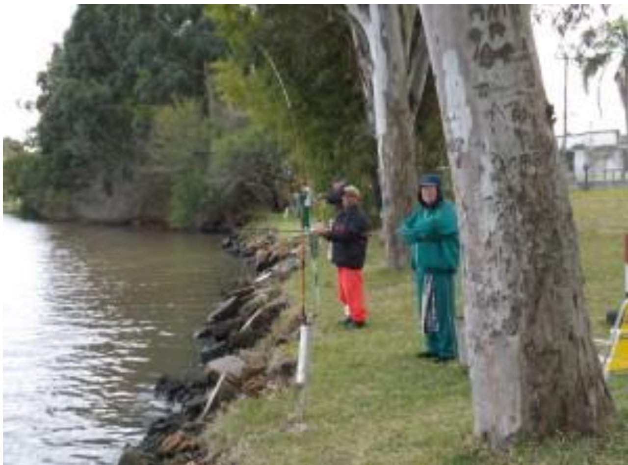
CARTOLA COM FRIO.....