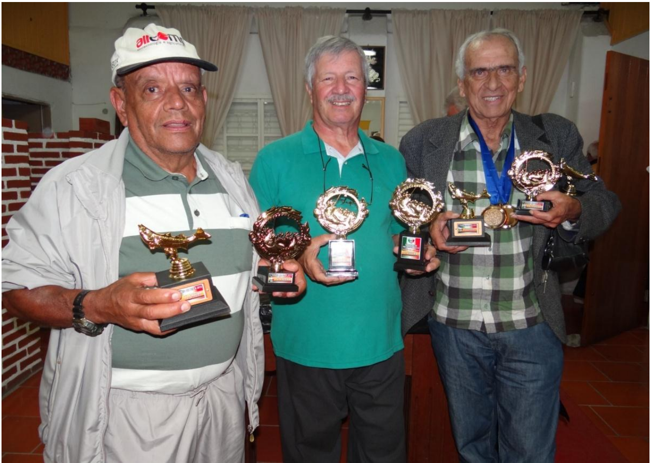
OSSO DURO DE ROER.....