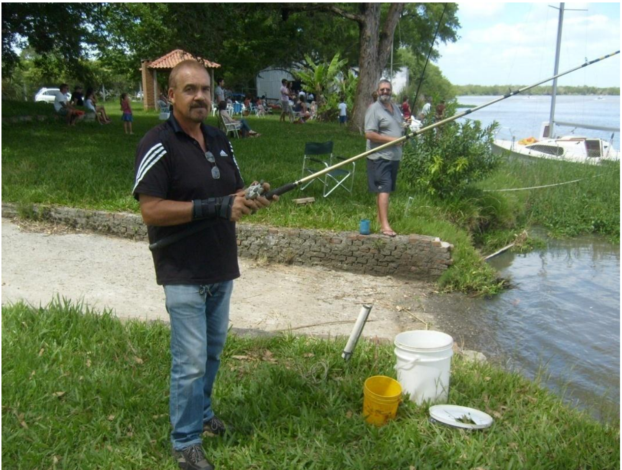
FOIVÁRIAS VEZES CAMPEÃO.....