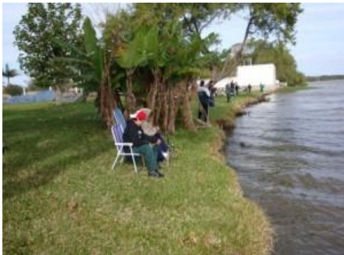
OS NOSSOS FUTUROS.....