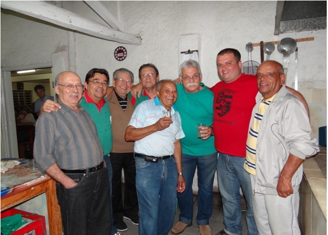
A TURMA DA COZINHA.....