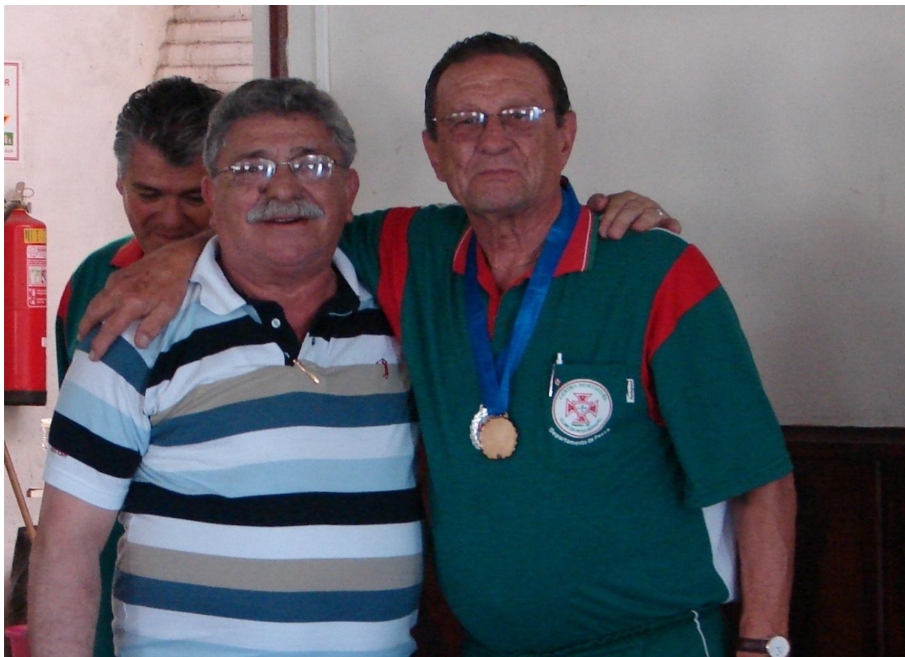
DOIS GRANDES BENFEITORES.....