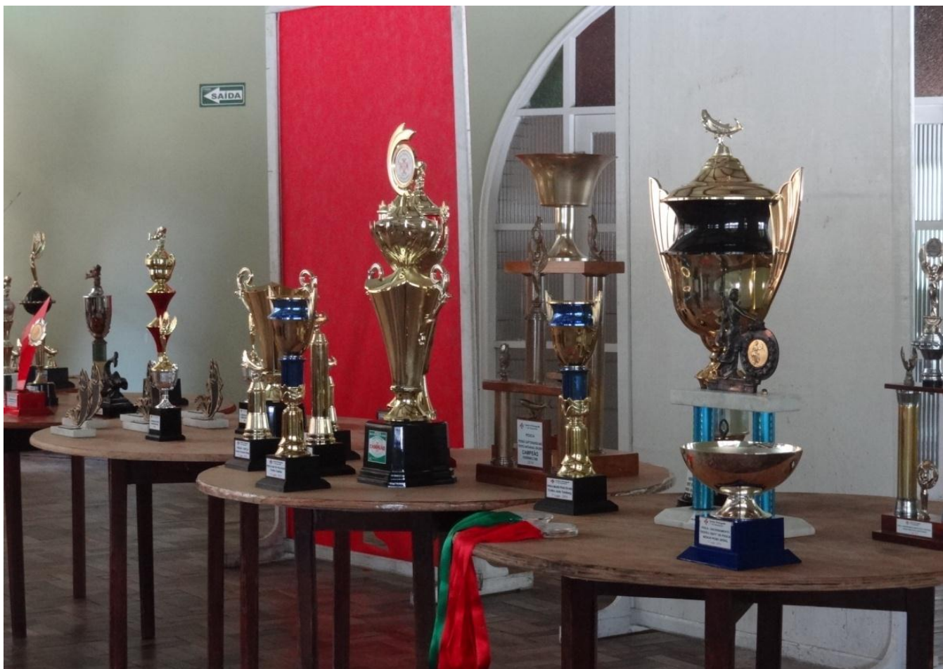
BELA PREMIAÇÃO, 2014.....