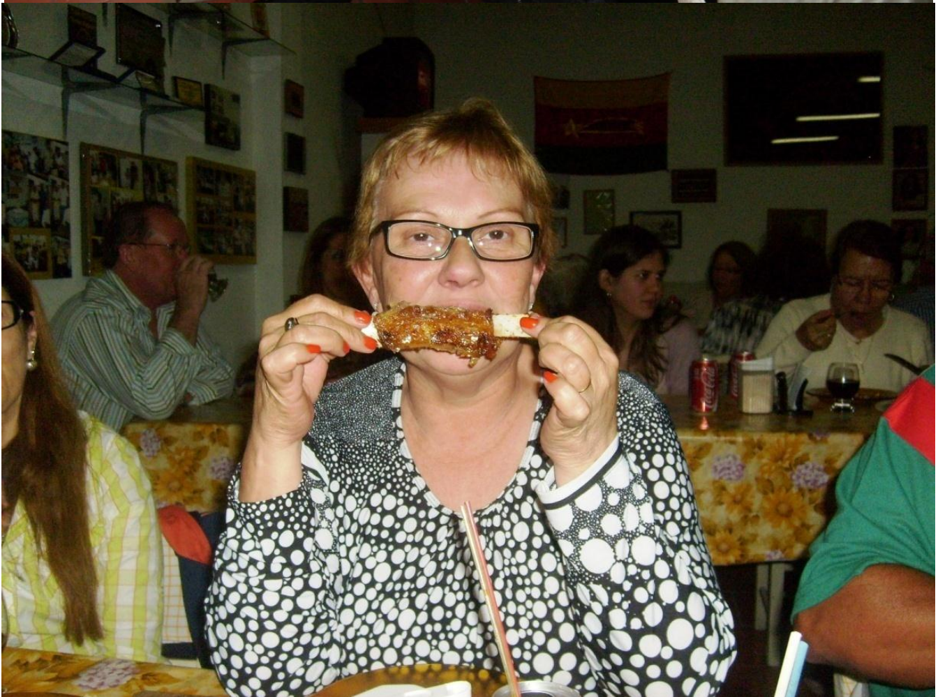
ETA, COSTELINHA GOSTOSA.....