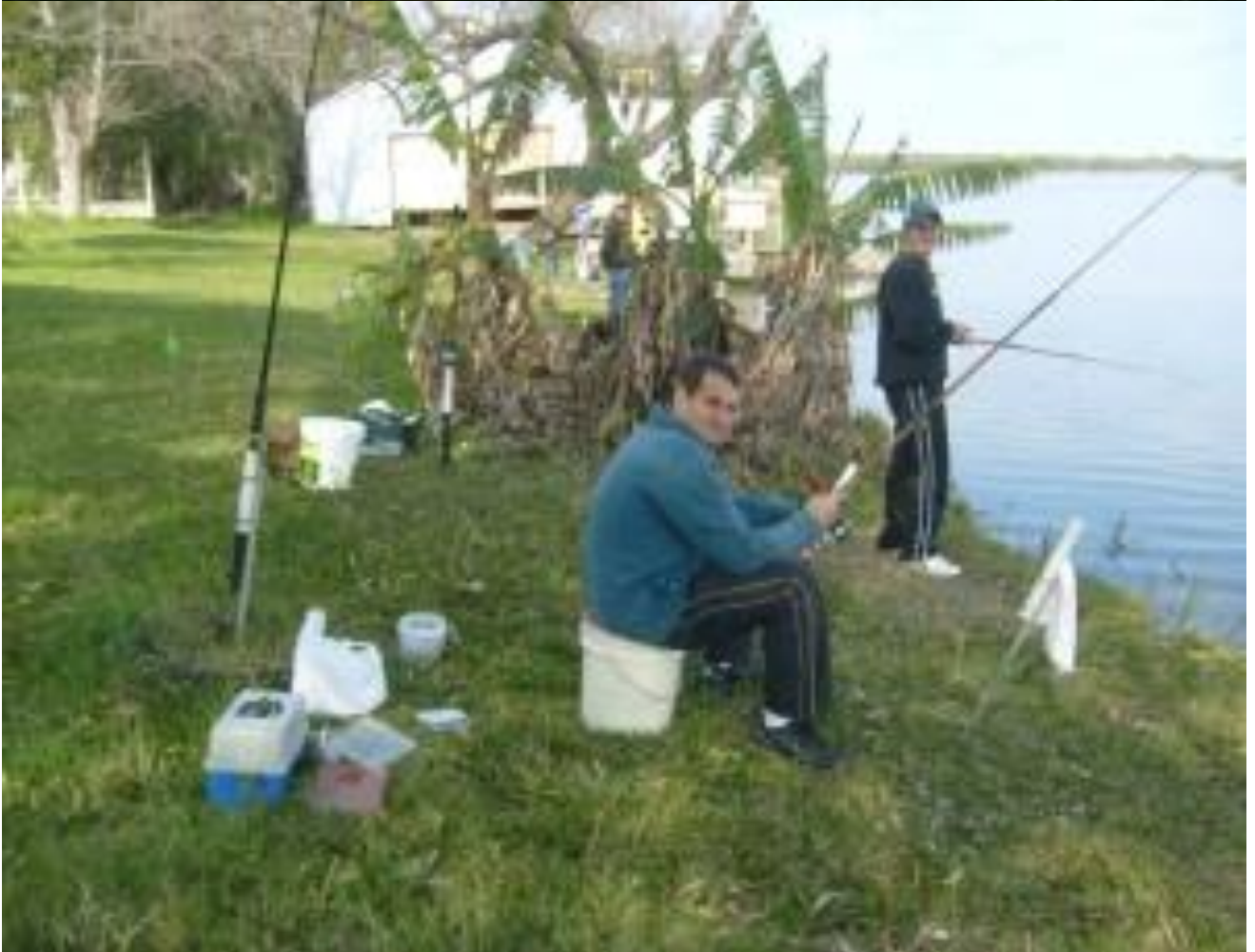
PAI E FILHO.....