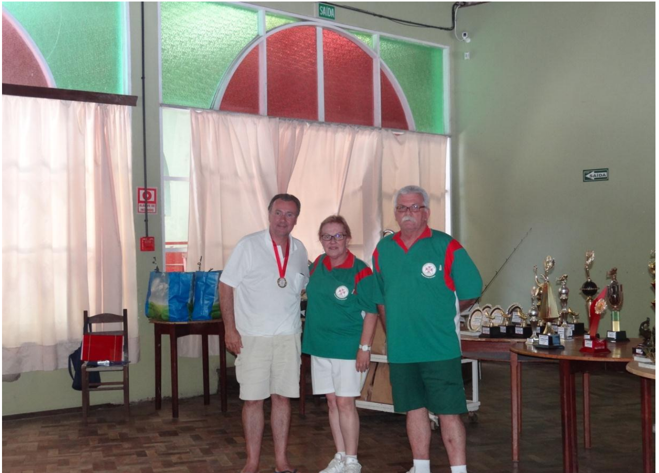
POR UM DETALHE.....