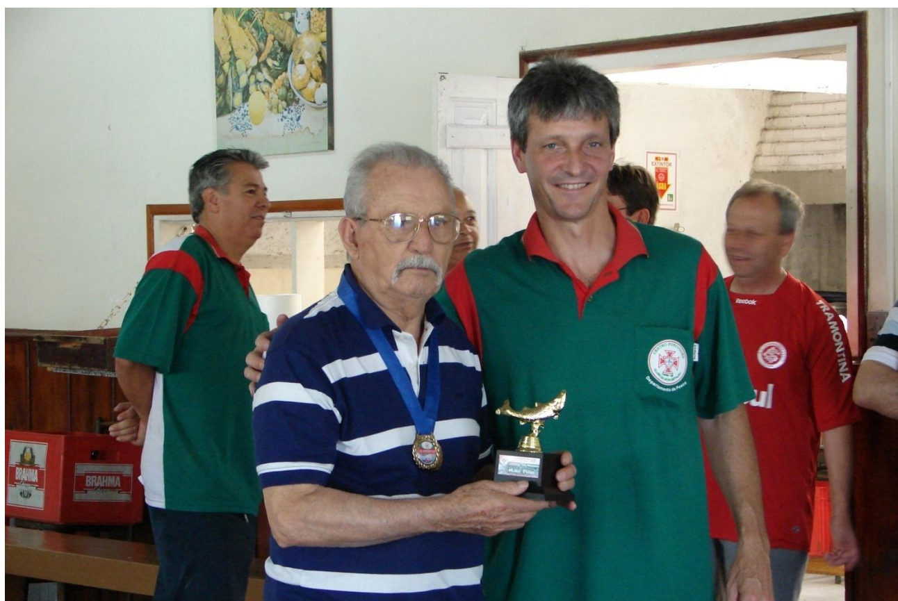
VICE PRES. ADM. PREMIANDO O GUERREIRO.....