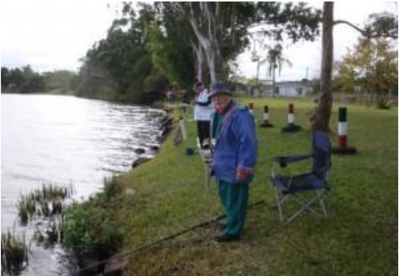
O GUERBEIRO MAIS VELHO.....